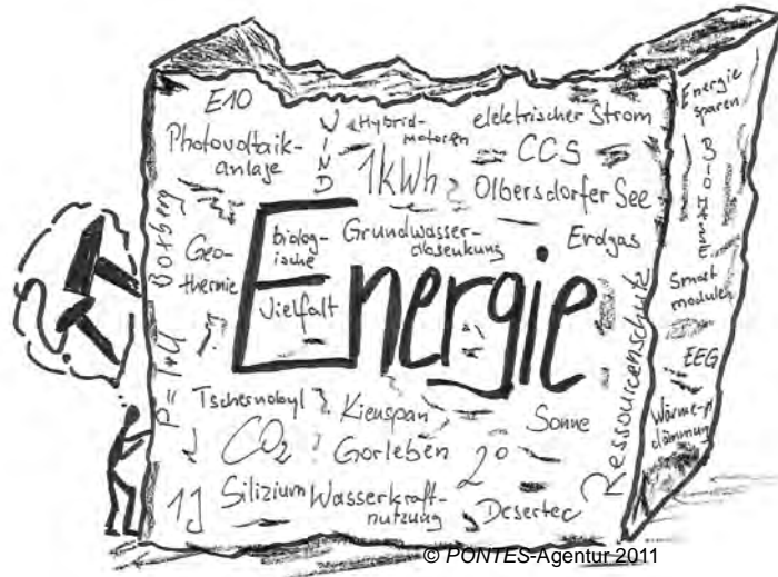
Abb. 1: Themenwirrwarr Energie

Energie ist ein weites Feld, das sich schwer auf wenige Themen oder Assoziationen beschränken lässt (vgl. Abb. 1). Im physikalischen Sinn ist Energie die Fähigkeit Arbeit zu verrichten; im philosophischen Sinn einem gedachten Zustand zur Wirklichkeit verhelfen, also eine Idee umsetzen.