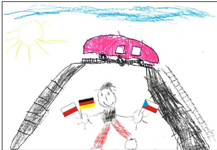
Milan, 5 Jahre

Fachtagung für LehrerInnen, ErzieherInnen und MitarbeiterInnen in der offenen Kinder- und Jugendarbeit