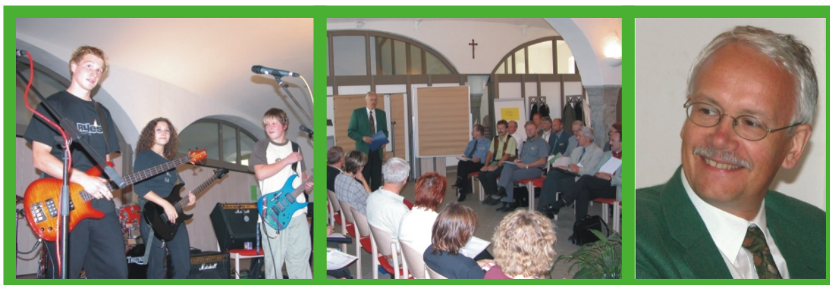
Eröffnung durch die Musikschule