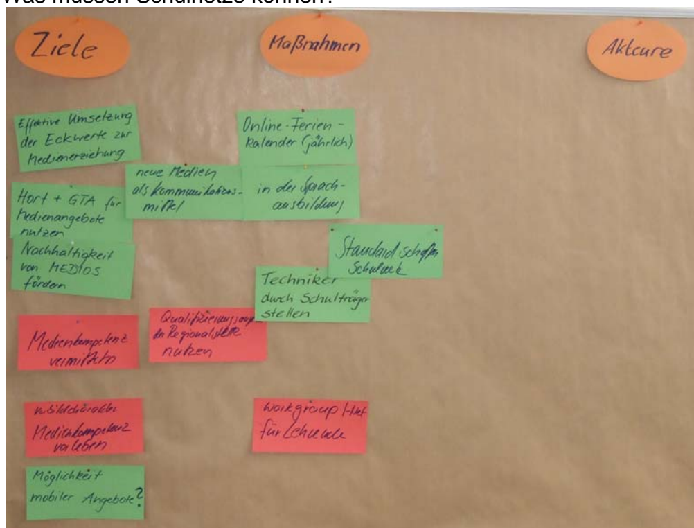
Konkrete Ergebnisse der Arbeitsgruppe „Schule und Lehrende“