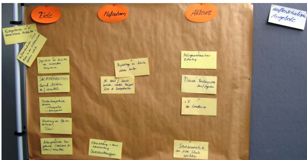
Konkrete Ergebnisse der Arbeitsgruppe „Außerschulische Arbeit“