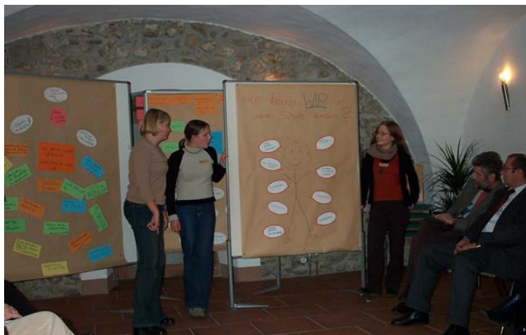
Obchodní místo (Geschäftsstelle) PONTES ■

Obchodní místo PONTESu kromě toho plánuje pro prováděcí fázi každoroční Open Space akce.